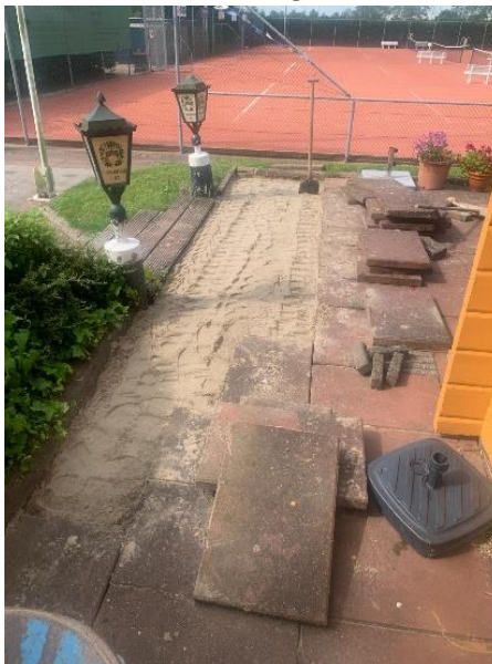
Situatie na 3,5 kruiwagen zand voor ophogen